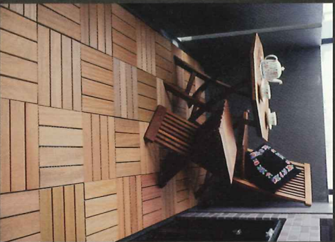
▶ 設置場所の広さに左右されない柔軟性